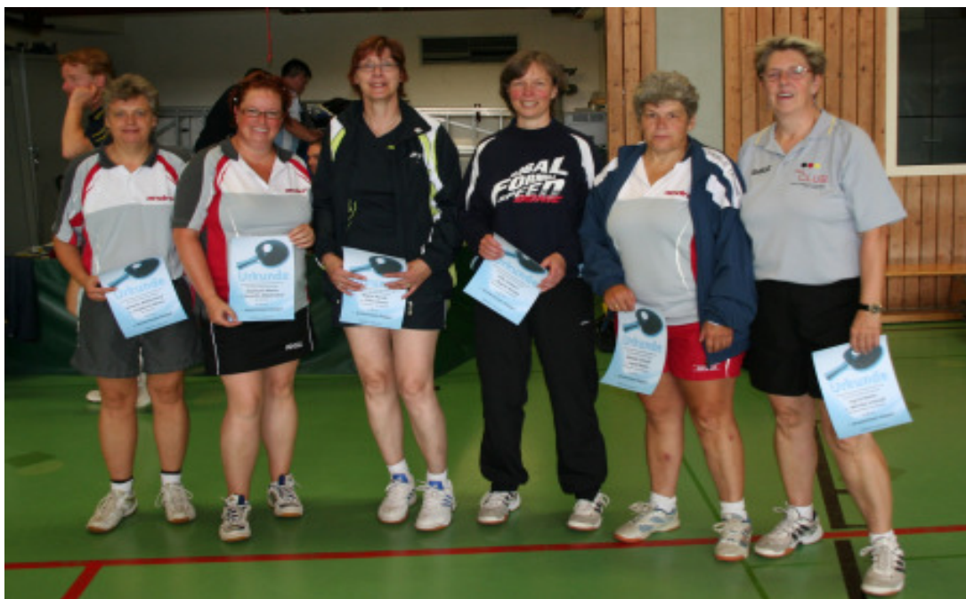
Siegerfoto Seniorinnen Doppel AK 40 - 60